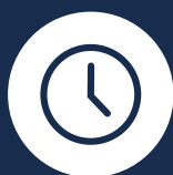
ASTA ASINCRONA (gara a tempo)

Parva Domus è in grado di gestire lo svolgimento delle Aste Telematiche nel rispetto delle regole tecnico operative stabilite dal Ministero della Giustizia, garantendo un agevole collegamento con il portale delle vendite pubbliche.